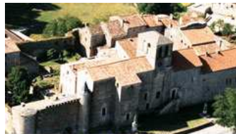
Saint Jean d'Alcas

Saint Jean d'Alcas village templier (30 km)